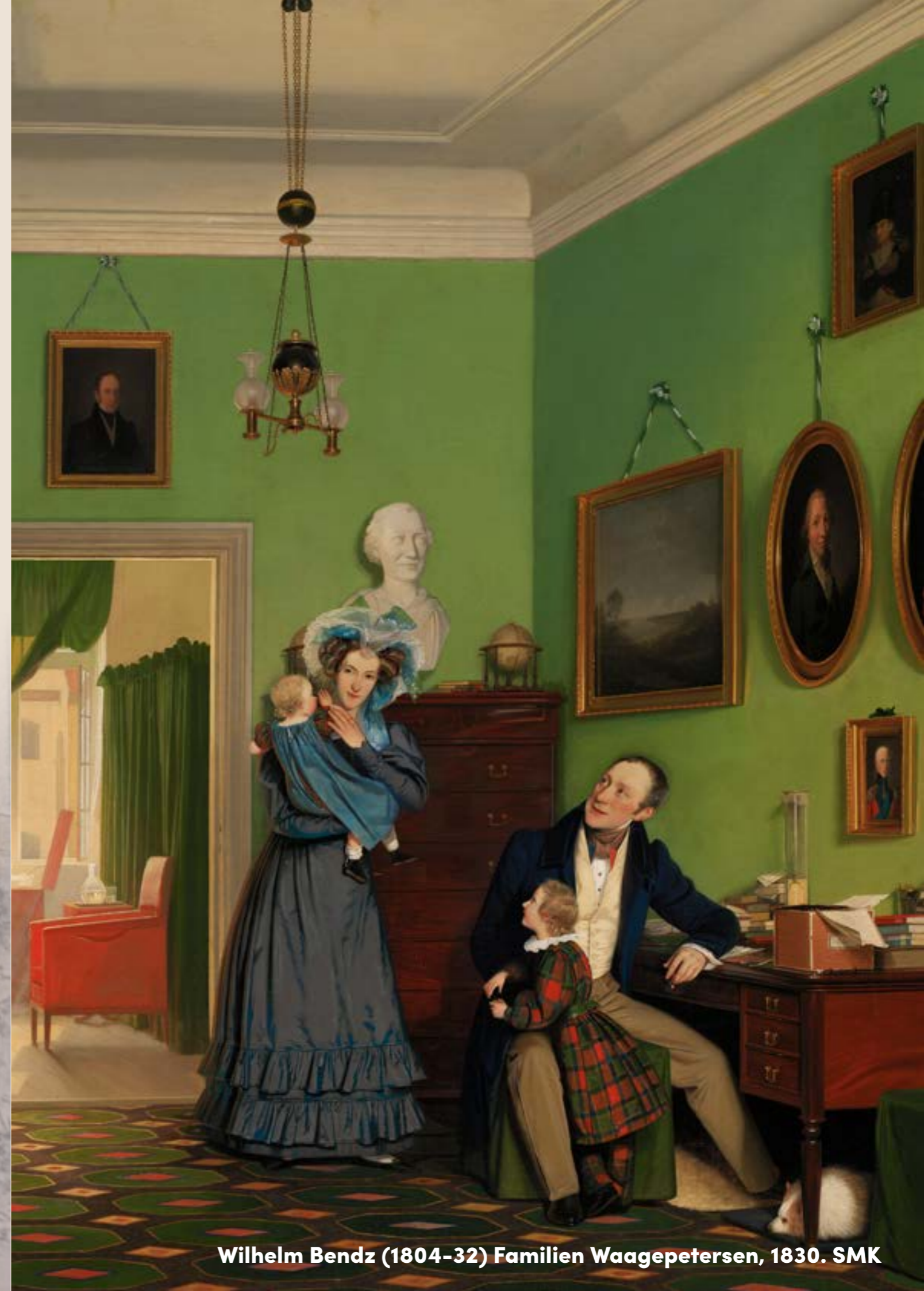
Wilhelm Bendz (1804–32) Familien Waagepetersen, 1830. SMK