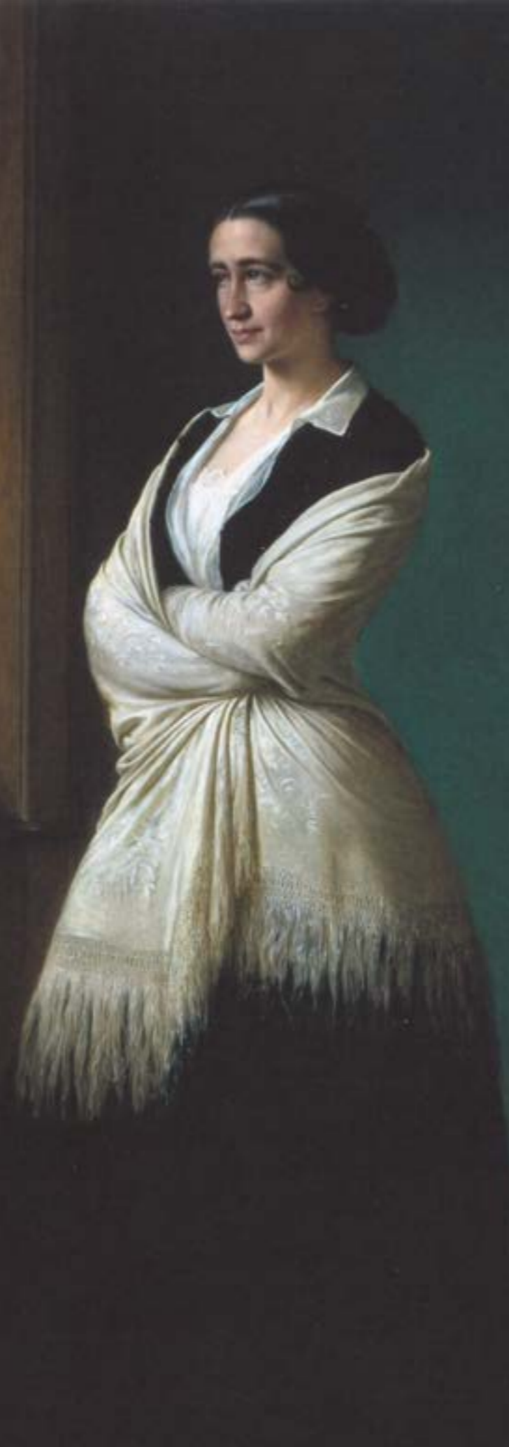
Wilhelm Marstrand, portræt af Johanne Luise Heiberg, 1859, Frederiksborgmuseet

Kommer du ind i en sådan dames værelse, kan du være temmelig vis på at finde alt i den ubehageligste uorden: Støv på alting; planter, som mangler vand; fugle, som de elsker, thi de har vinger; imens de forsømmer at give dem æde; de selv malpropre – og alt det, uagtet de kun leve for det skønne! Som om det skønne kun fandtes i poesien, og som om ikke poesien fandtes i livet.