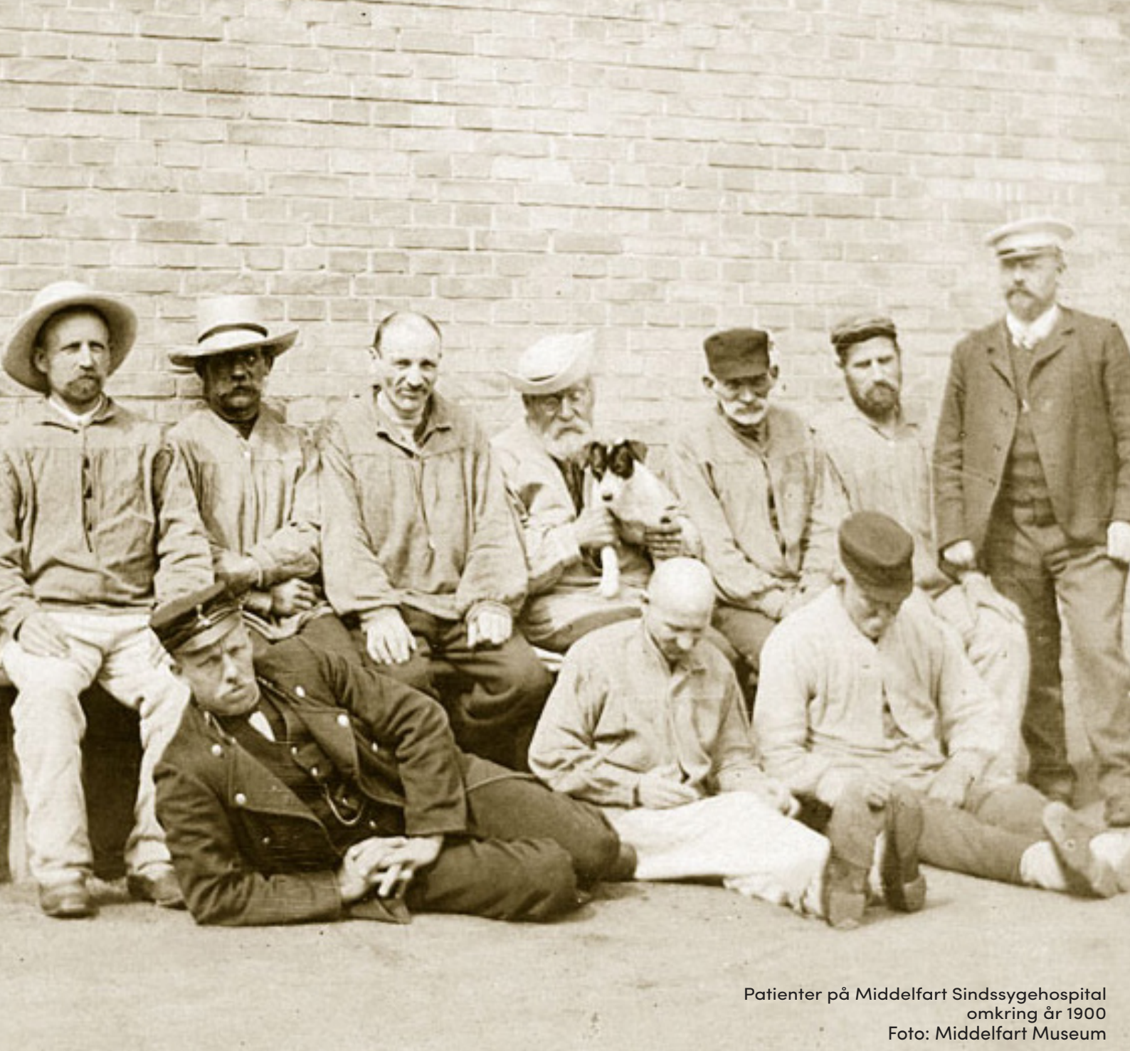
Patienter på Middelfart Sindssygehospital omkring år 1900