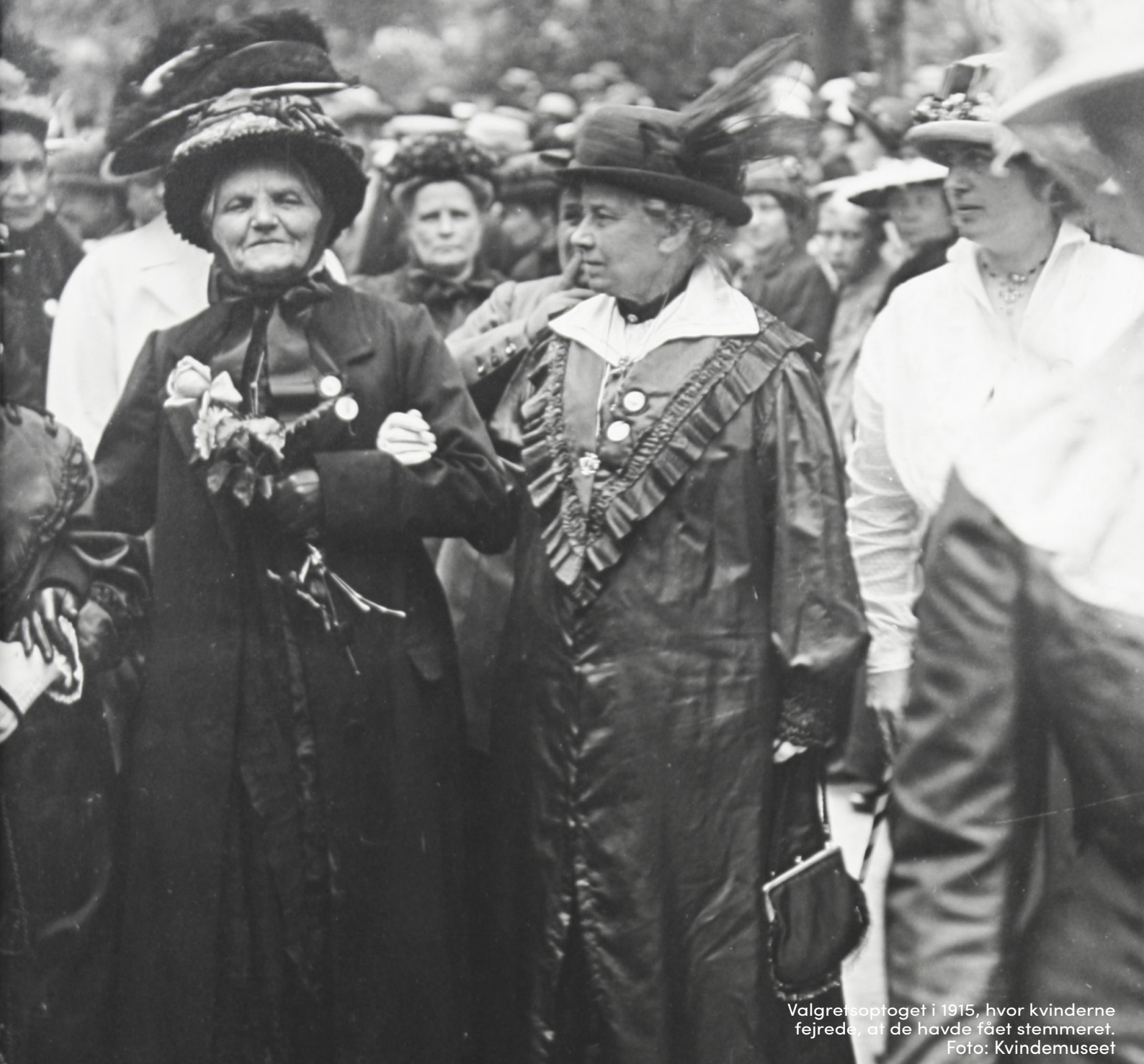
Valgretsoptoget i 1915, hvor kvinderne fejrede, at de havde fået stemmeret.