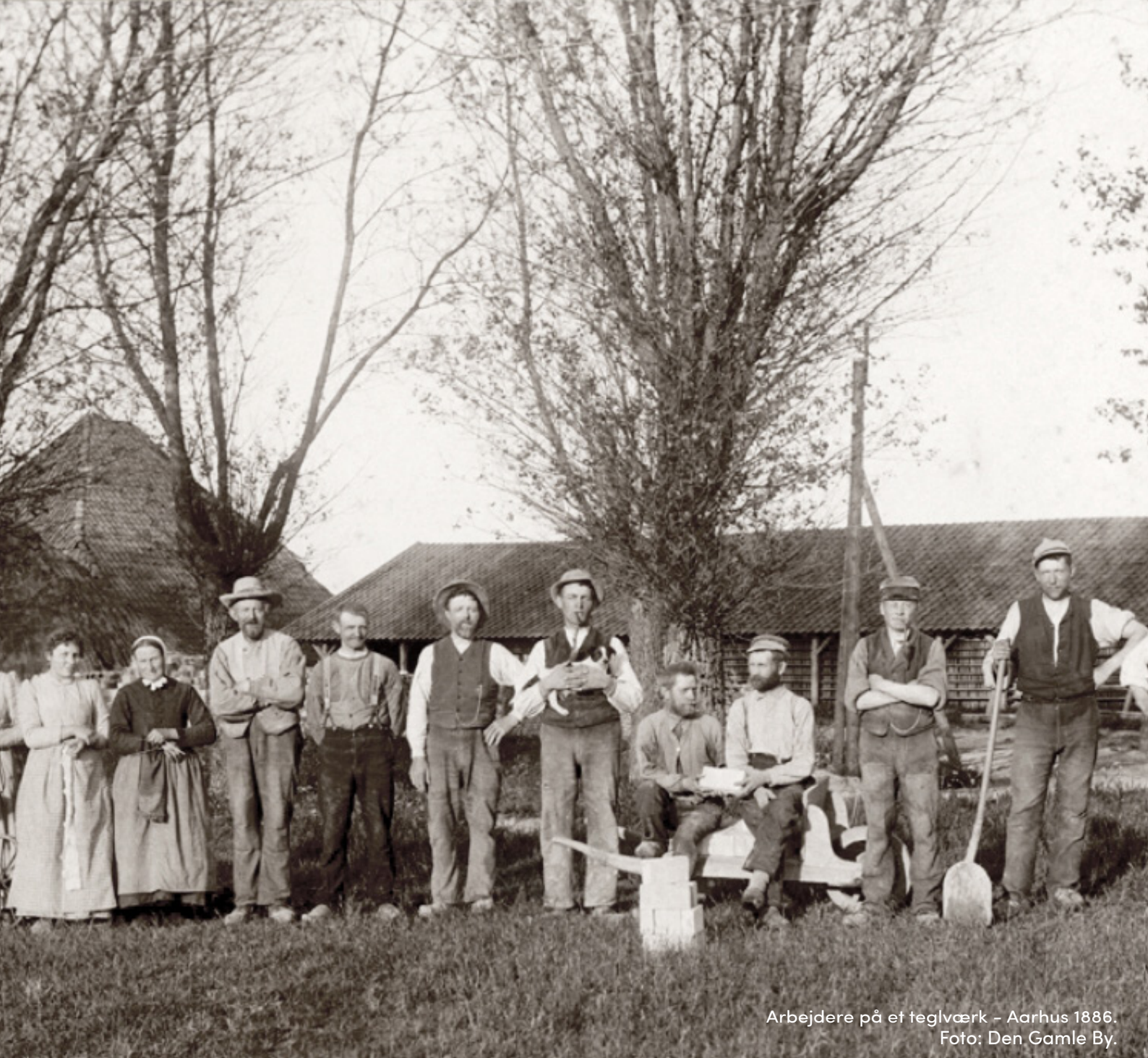
Arbejdere på et teglværk - Aarhus 1886.