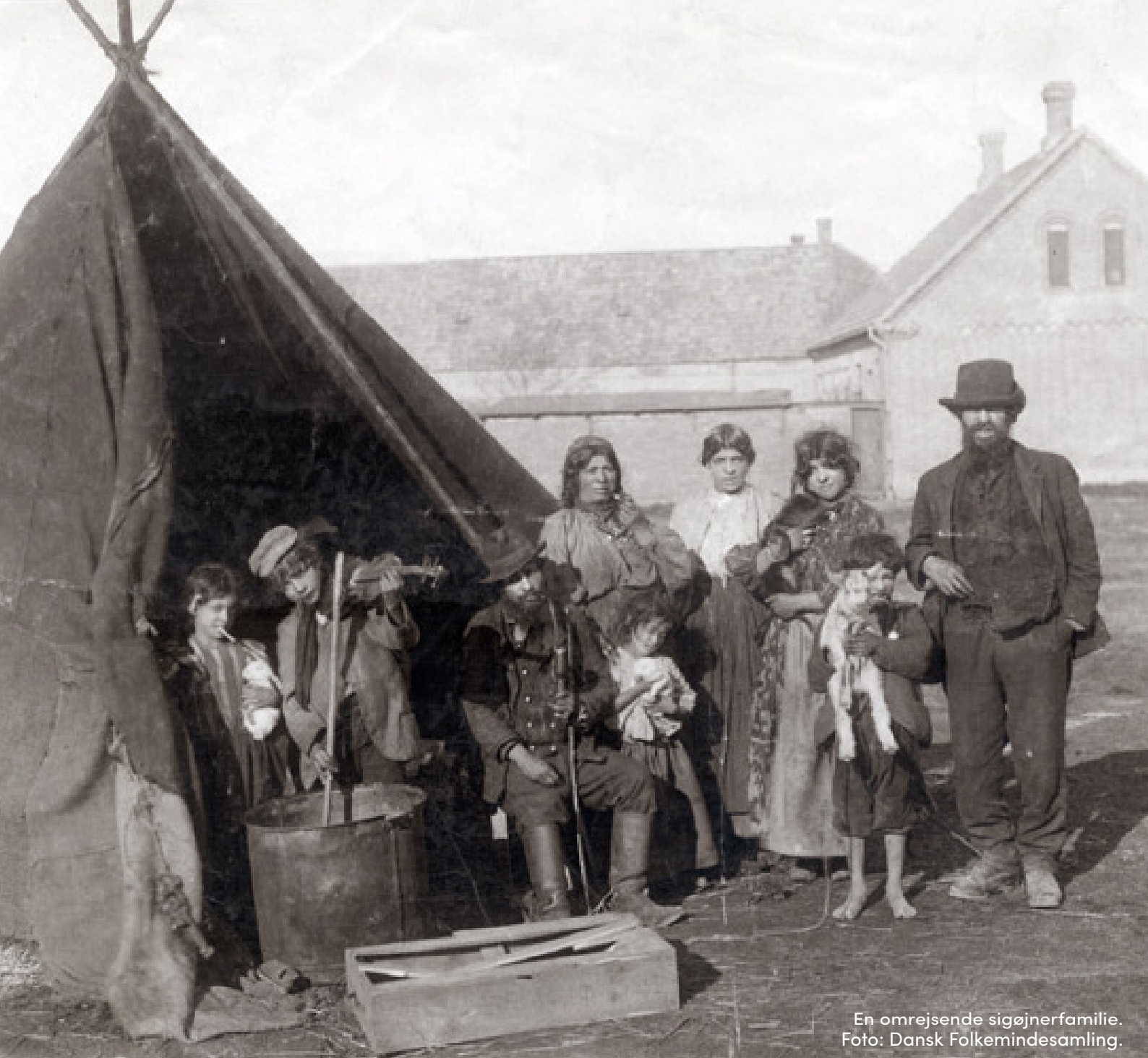
En omrejsende sigøjnerfamilie.